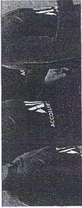
O PSG quer aproveitar a presença de atletas brasileiros no seu elenco para conquistar sócio-torcedores no Brasil.

U Paris Saint-Germain decidiu extrapolar as fronteiras da França e abrir um programa de sócio-torcedor exclusivo para os brasileiros. O clube aposta na ligação com a terra de Neymar, Marquinhos e Thiago Silva e na oferta de vantagens para atrair quem mora na América