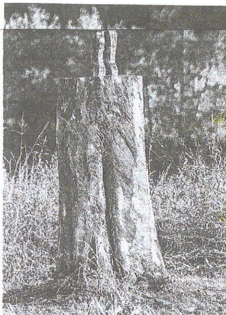
Estátua de protesto

FBI Os crimes violentos e contra a propriedade privada