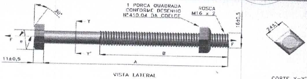
TABELA 1 - CARACTERÍSTICAS