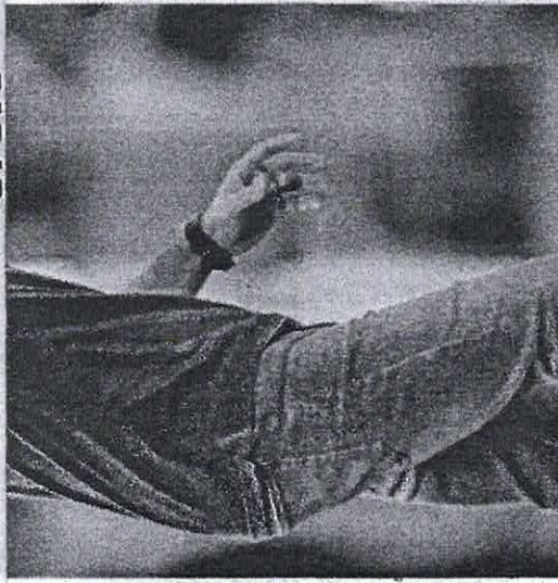
Vojvoda disputa novo clássico pelo Leão