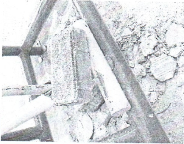
ALGUNS EQUIPAMENTOS sofrem vandalismo