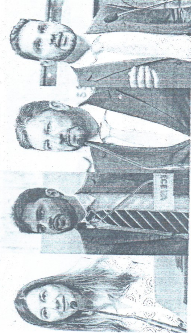
DEPUTADOS aliados de Cid pediram para sair do PDT

JUNIOR PIO/ALECE; THAÍS MESQUITA EM 11.11.2022. DIVULGAÇÃO/ ASCOM ROMEU ALDIGUERI